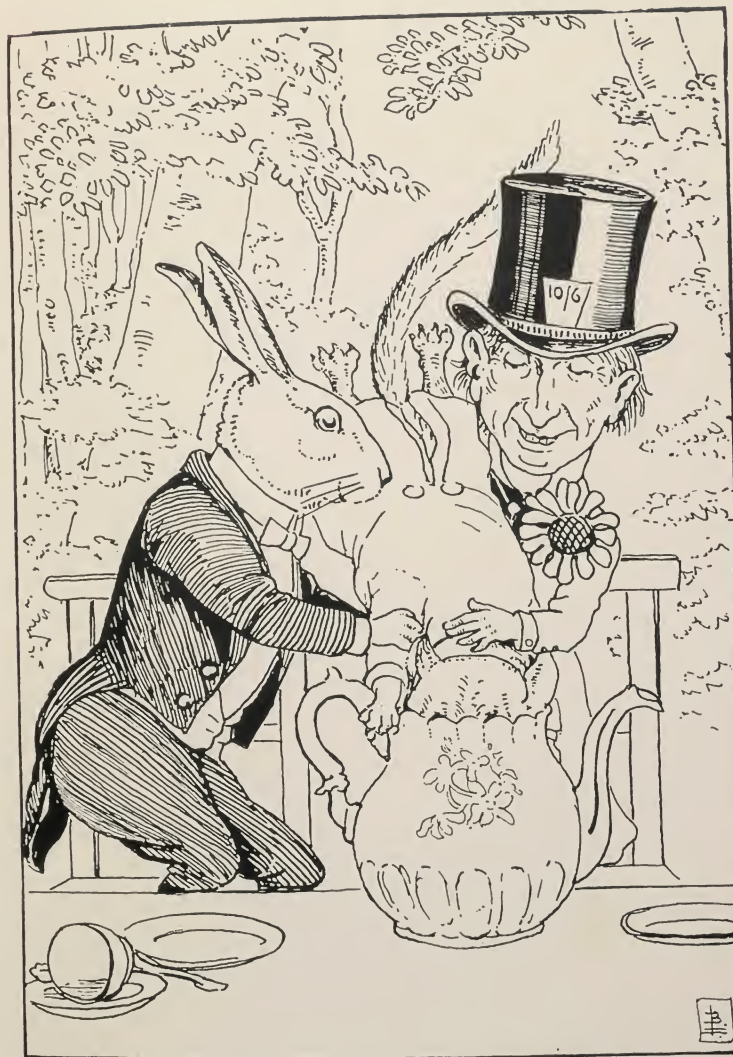
LA GLIRO ESTAS ENIGATA EN LA TEKRUĈON.

“Neniam mi volos reviziti ilin ” diris Alicio.